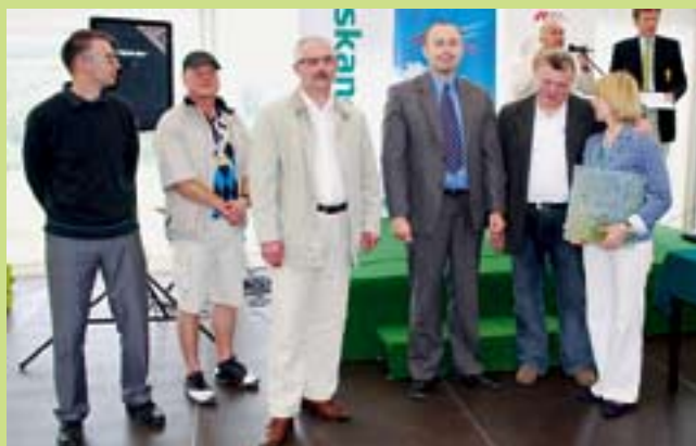
Organizatorzy i sponsorzy