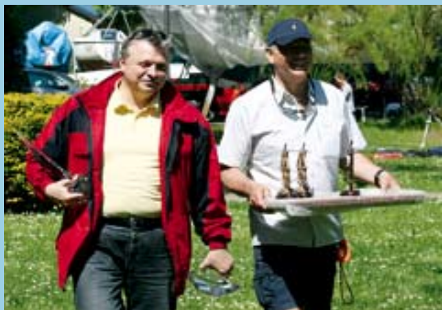
Cenne fanty w rękach prezesów