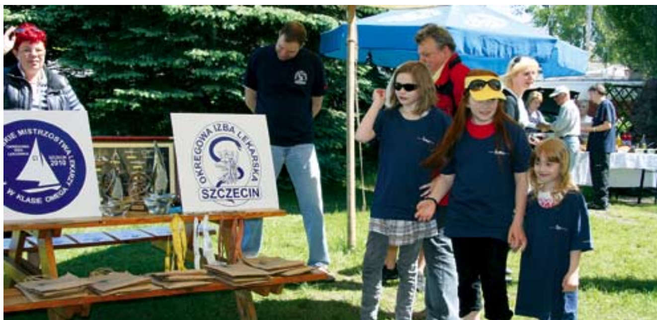
W oczekiwaniu na zawodników

Do regat zgłosiło się 8 załóg reprezentantów szpitali i prywatnych praktyk lekarskich i lekarsko-dentystycznych.