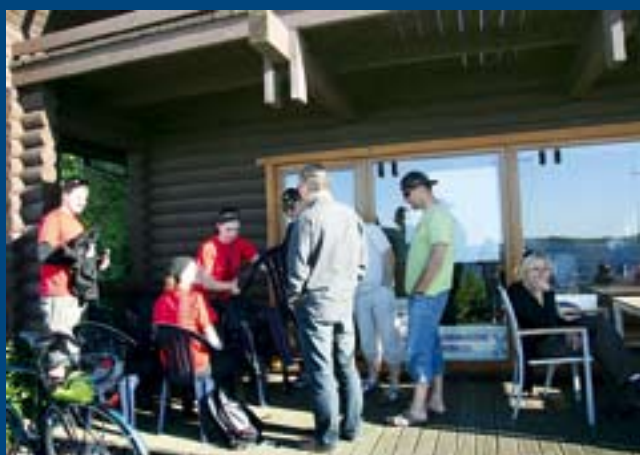
W oczekiwaniu na rozstrzygnięcie protestów