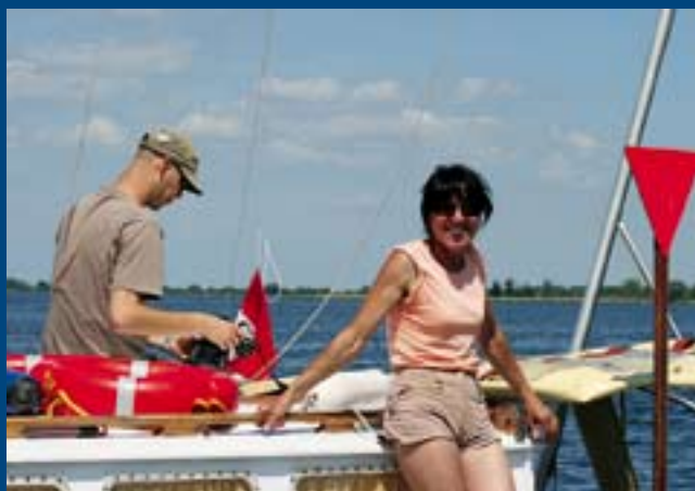
Sędzina w akcji