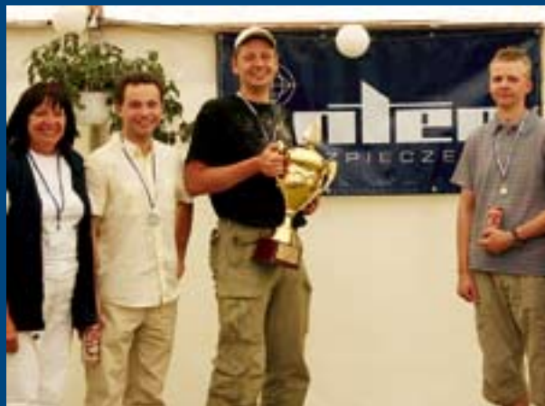
Zdobywcy II miejsca