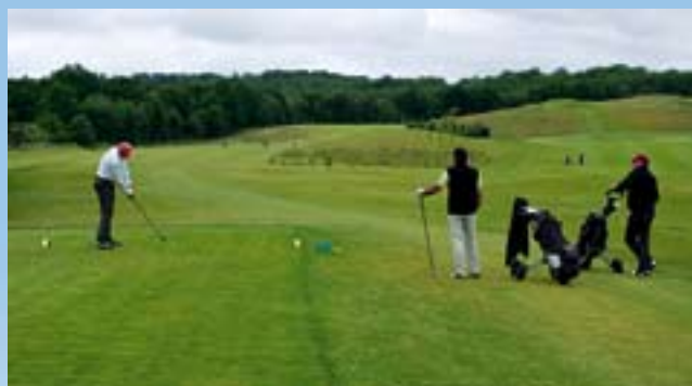
Tomaszek W, Paluch R. (start – dołek nr 1)