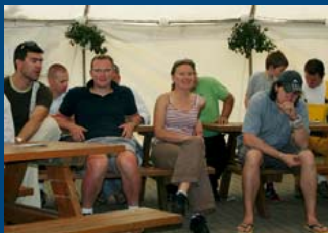
Uczestnicy przed rozdaniem nagród