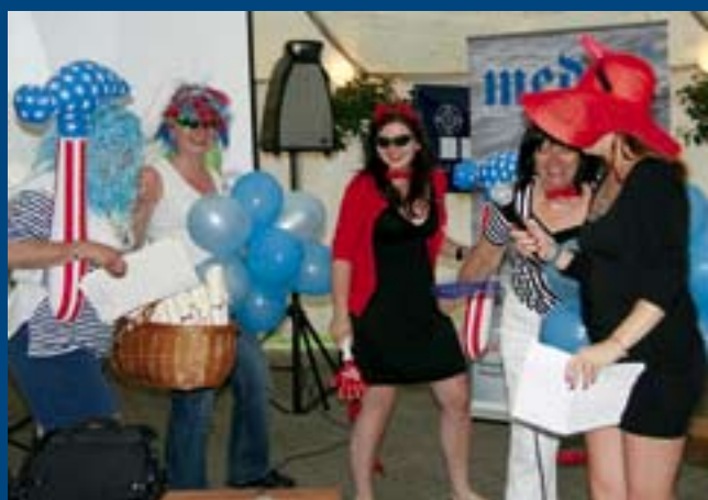
Diabelski orszak króla TOPIKA