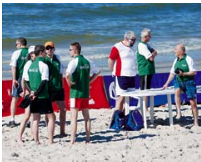
Chwilowa przerwa w grze