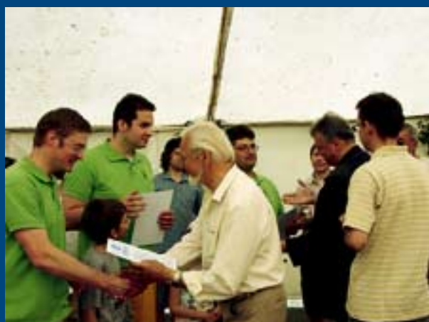
Zdobywcy III miejsca