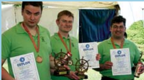
Zdobywcy III miejsca