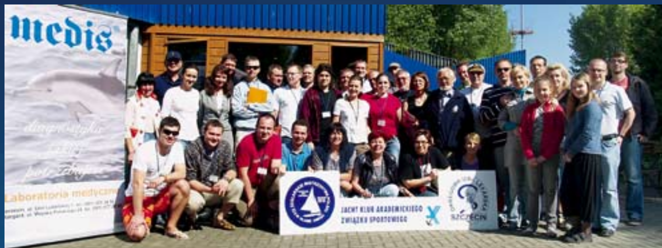
Uczestnicy regat ogólnopolskich