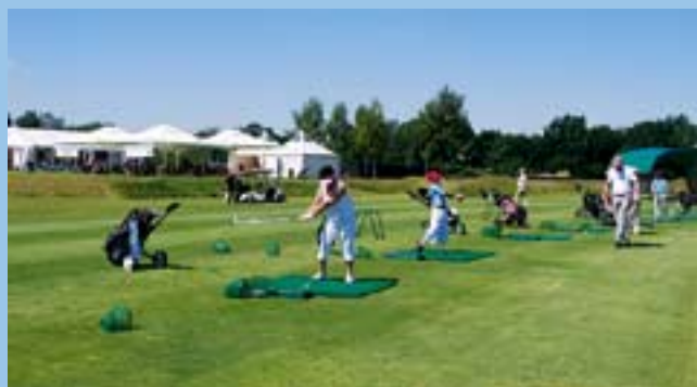
Driving range (pole treningowe długich uderzeń)