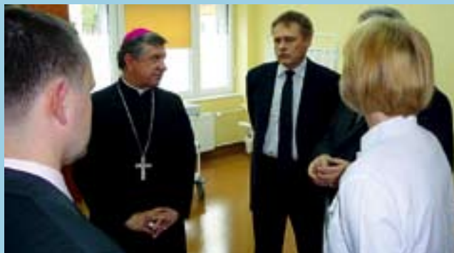
Otwarcie poradni kardiologicznej

H.T. Budynki, pomoc władz przy organizacji Szpitala to nie wszystko. Przyczna Pan Dyrektor, że bez lekarzy i zastępu pielęgniarek – pasjonatów nie byłoby co wspominać.