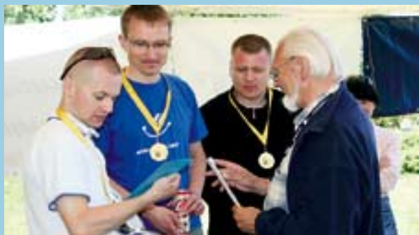
Zdobywcy I miejsca