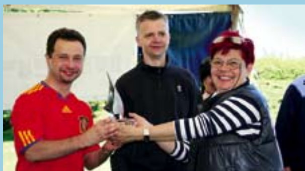
Zdobywcy II miejsca