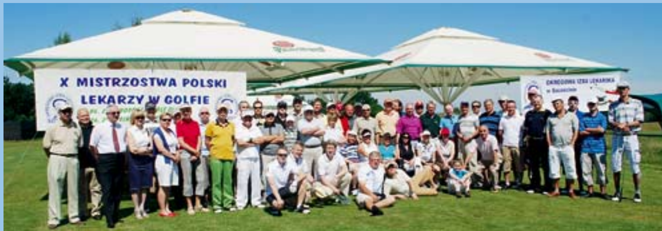
Otwarcie mistrzostw – Modry Las, pole 18 dołkowe, par 72, długość 6657 m. – Choszczno