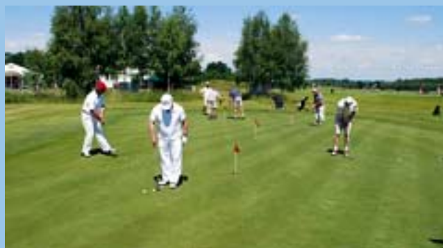
Green (pole treningowe krótkich uderzeń) – Modry Las