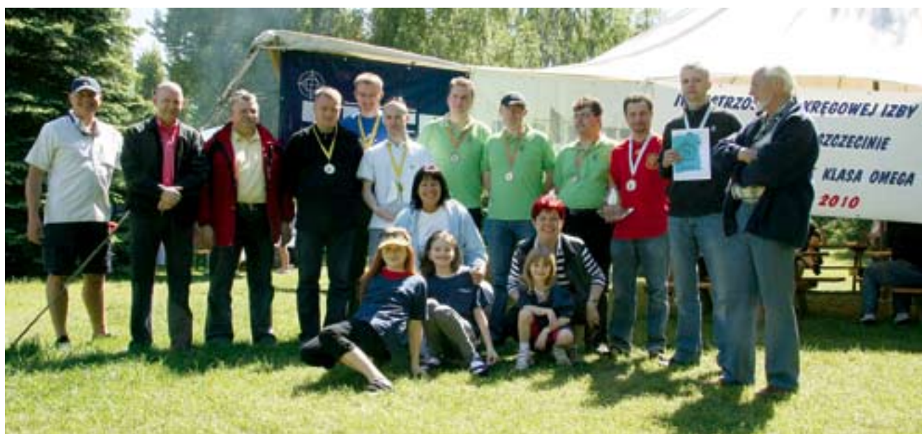
Organizatorzy i sponsorzy regat ze zdobywcami nagód

Wody Jeziora Dąbskiego i piękna marina Jacht Klubu AZS-u przy ul. Przesznernej 9 gościły żeglarzy lekarzy i lekarzy dentystów naszej Izby. Załogi walczyły dzielnie. Duch walki i zawziętość były przyczyną tego, że do końca ważyły się losy czołowych miejsc. Zgodnie z przepisami żeglarskimi załogi ukończyły wyścigi, no może oprócz kolegów