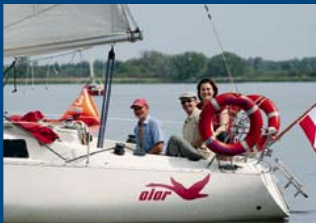
Ekipa OIL gościnnie na pokładzie Olora