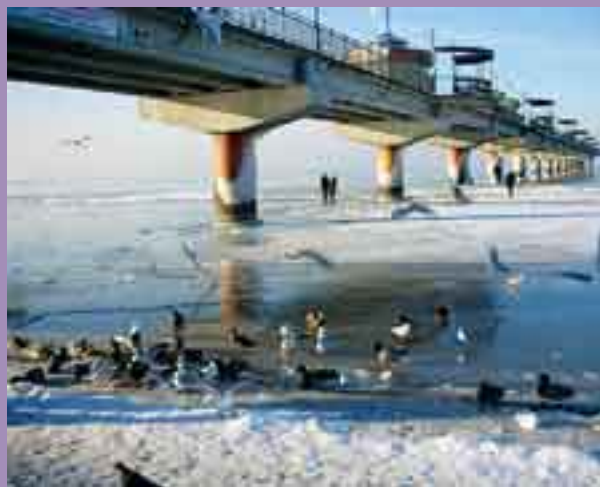
Marznące ptaszki na lodzie