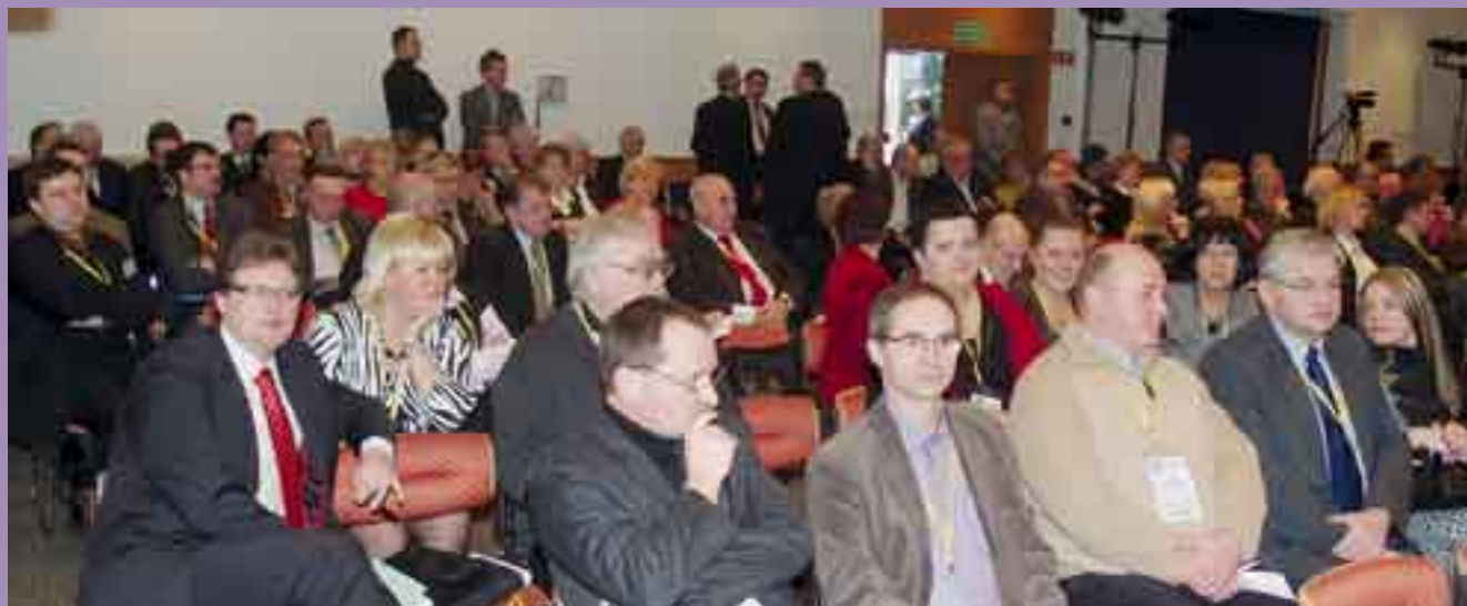
Nasi na zjeździe w Warszawie

Pierwszego dnia odbyły się wybory do wszystkich komisji zjazdowych oraz prezes Konstanty Radziwiłł wygłosił sprawozdanie z przebiegu V kadencji samorządu lekarskiego (NRL). Do wygłoszonego sprawozdania uwagi zgłosiła Komisja Rewizyjna, występując o nieudzielenie absolutorium odchodzącej NRL, podając za przyczyny sprawy spółki Medbroker i zbytnią rozrzutność przy organizacji centralnych obchodów 20-lecia samorządu lekarskiego. Po burzliwej dyskusji NRL absolutorium uzyskała. Głosowało 218 delegatów, w tym 90 przeciw i 30 się wstrzymało. Interesujące, że w głosowaniu nad sprawozdaniem Komisji Rewizyjnej głosowało 176 delegatów, przy czym przeciw 111, a 53 się wstrzymało.