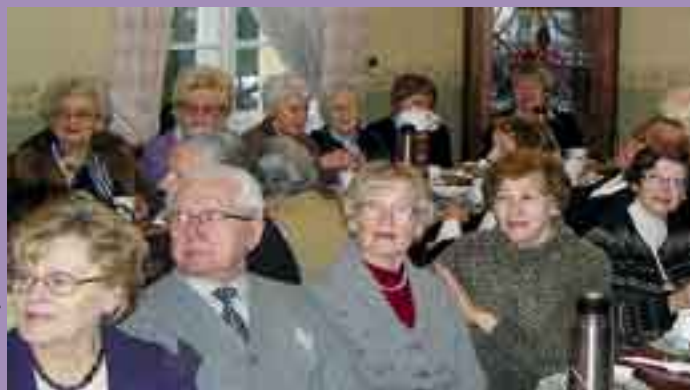
Koło Seniora obraduje