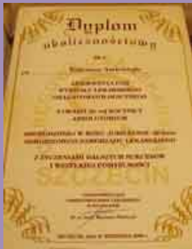
Takie dyplomy otrzymali wszyscy uczestnicy zjazdu