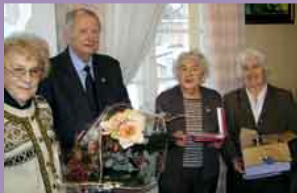
Uroczysta część spotkania