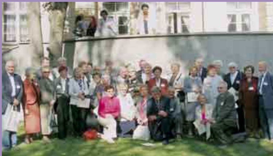
Absolwenci w ogrodzie przed siedzibą Izby