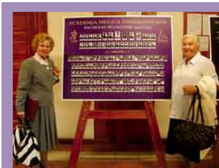
Tableau rocznika 1959 w budynku Rektoratu PAM